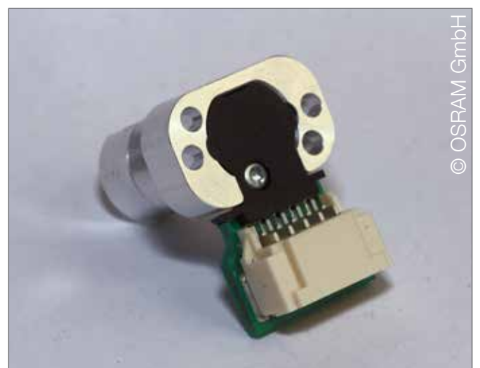
Anwendung in miniaturisiertem laseraktiviertem Remote-Phosphor-Gerät \mu LARP (Laserlicht für PKWs)

Aufgrund der gewindefurchenden Geometrie der EJOT® Mikroschrauben sind selbst bei hochbeanspruchten Bauteilen Einlegeteile oder Inserts überflüssig. Auch schwierige Vorarbeiten, wie beispielsweise Gewindeschneiden, entfallen beim Einsatz der Kleinstschrauben. Durch ihre individuellen, speziell auf die verwendeten Werkstoffe abgestimmten Gewindegeometrien sind sie weitgehend material-unabhängig einsetzbar. Zudem sind sie aufgrund ihrer Reparaturfähigkeit die bessere Alternative zu Löten, Kleben, Klipsen oder Schweißen.