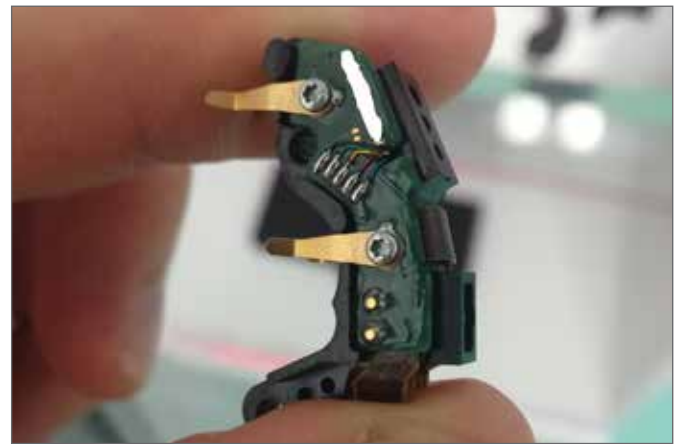
Anwendung im Cochlea-Implantat-System (Hörprothese für Gehörlose)